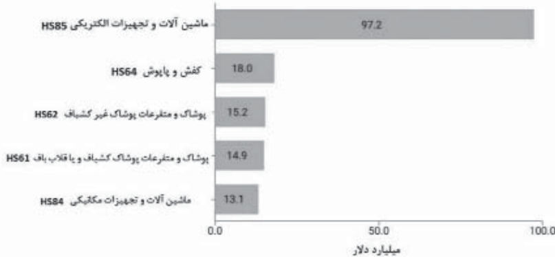
برترین محصولات صادراتی کشور ویتنام (۲۰۱۹)

Note: 2019 is latest available direct data